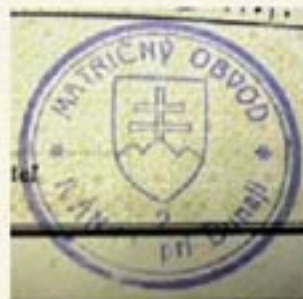
Pečiatka ivanskej matky zobdobia Slovenskej republiky (1942)