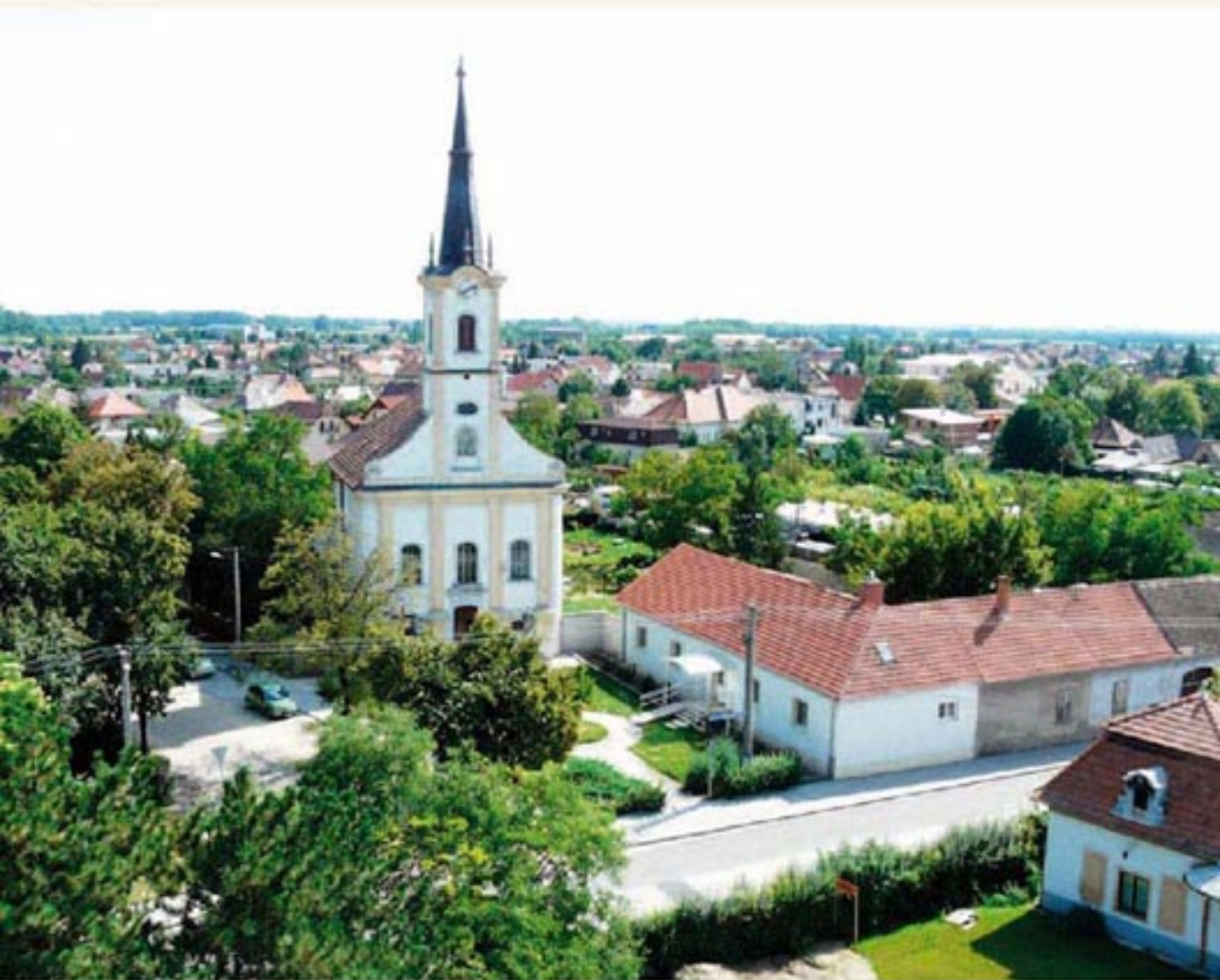
1. Ústný pohľad na obec