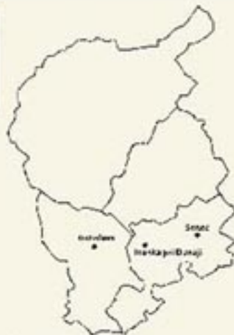
Bratislavský kraj okres Senec