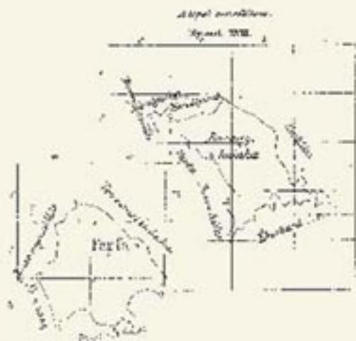
Hranice katastrálnych území Ivanka a Zálesie

Podľa prebiehajúceho vývoja územnej správy a v rámci zmien vlastníckych práv k nehnuteľnostiam v obci, menili a upravovali sa aj katastrálne územia