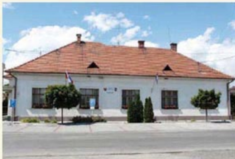
Sídlo obecného úradu

Po revolúcii v roku 1989 boli zrušené národné výbory a výkon miestnej štátnej správy prevzali až do roku 1996 obvodné a okresné úrady. V júni 1996 nadobudol platnosť nový zákon o územno-správnom členení Slovenskej republiky, v rámci ktorého vznikol systém miestnej štátnej správy s okresmi a kraji, územne totožnými so samosprávnymi kraji – vyššími územnými celkami. Ivanka sa podľa tohto územného členenia nachádza v okrese Senec, v Bratislavskom samosprávnom kraji.